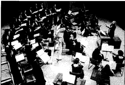
Bach Collegium Japan