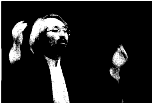
Masaaki Suzuki conductor